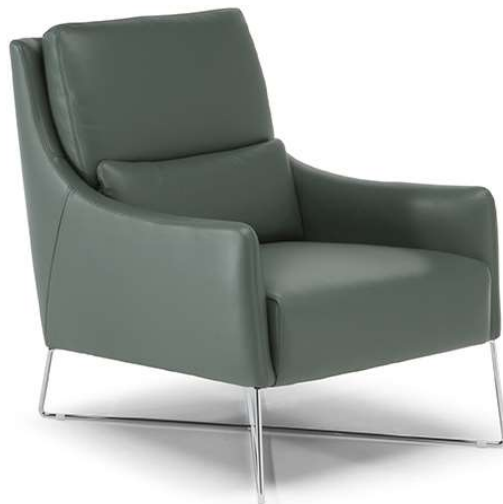
■ Vers. 003