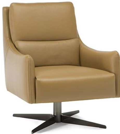
■ Vers. 066