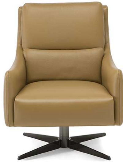
■ Vers. 066